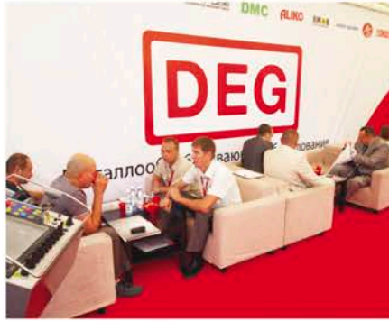
Стенд компании «ДЕГ-РУС» на выставке «ТЕХНОЭКСПО. 2012» г. Саратов.

Затем в Саратове проходила выставка «ТЕХНОЭКСПО. 2012», где мы также приняли активное участие. Наша компания стала спонсором выставки и провела небольшую рекламную кампанию в Саратове с целью привлечь как можно больше посетителей и тем самым увеличить интерес к выставке. Я думаю, что в следующем году многие поставщики металлообрабатывающего оборудования примут участие в выставке «ТЕХНОЭКСПО», оценят значимость и перспективы развития данного проекта.