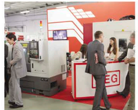
Стенд компании «ДЕГ-РУС» на выставке «Машиностроение. Металлообработка. Казань-2012».

ракетно-космической промышленности, с которыми мы сотрудничаем в рамках Международной ассоциации участников космической деятельности (МАКД). Подробнее о данном семинаре мы расскажем в нашей следующей статье.